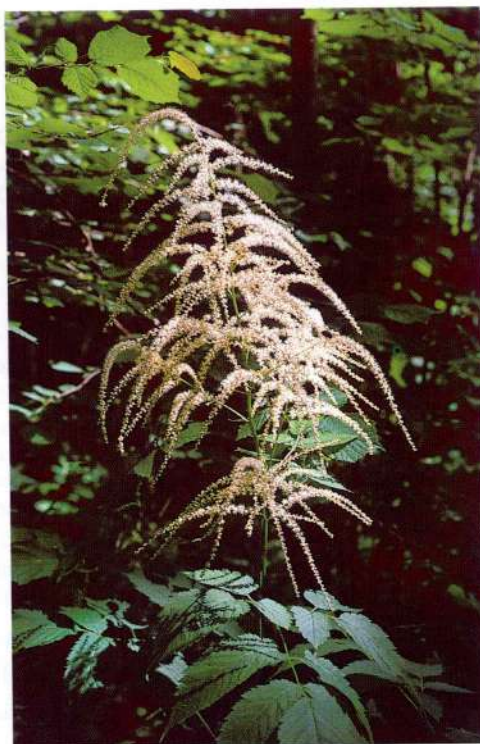
Fig. 3 - Pianta di Aruncus dioicus in fioritura al margine di una strada forestale. - Blooming of Aruncus dioicus on the edge of a forestal road.

All'interno di materiale legnoso sono stati rinvenuti anche individui adulti svernanti non in celletta pupale; in particolare, in una cavità relativamente ampia presente in una ceppaia cariata di Alnus sp., del diametro di circa 20-25 cm, sono stati rinvenuti due adulti di Parmena unifasciata assieme a due Araneidae, due Dermatteri e un Rincoto Omottero Auchenorrhinco. Il ritrovamento dei due adulti di P. unifasciata conferma le indicazioni di PESARINI & SABBADINI (1995) riferite allo svernamento dei rappresentanti del genere Parmena .