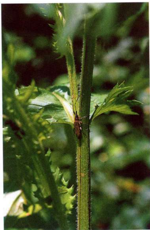
Fig. 2 - Adulto di Agapanthia villosoviridescens su stelo di Cirsium erisithales . - Adult of Agapanthia villosoviridescens on stem of Cirsium erisithales .