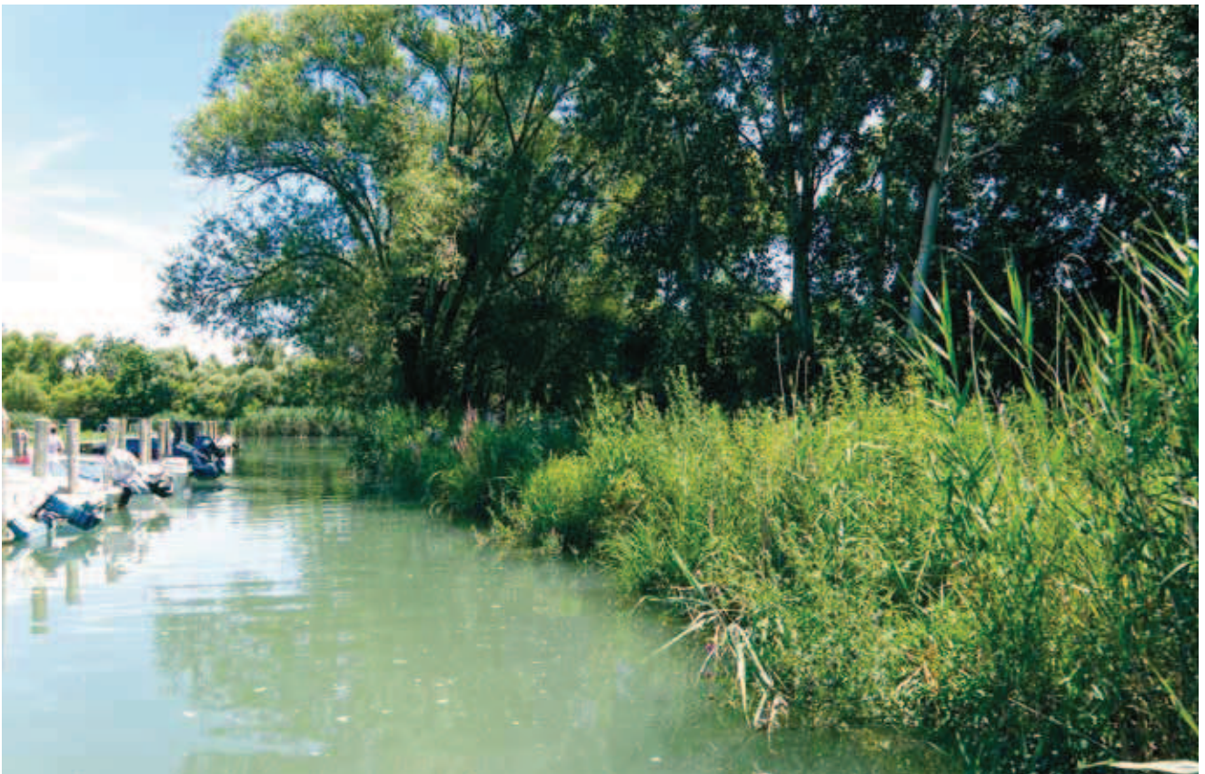
Fig. 5 - Habitat di Zeuneriana marmorata lungo il Rio Muzzanella. - Habitat of Zeuneriana marmorata along Rio Muzzanella.