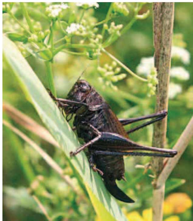
Fig. 3 - Zeuneriana marmorata ♀, Foce dell'Isonzo. - Zeuneriana marmorata ♀, mouth of Isonzo River.

australis e da praterie umide a Schoenus nigricans e Juncus maritimus con proliferazione di Phragmites australis , che vegono occasionalmente inondati. La zona, nel corso degli ultimi 20 anni, ha tuttavia subito dei cambiamenti, in particolare per quanto riguarda l'assetto vegetazionale.