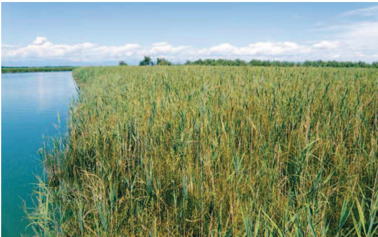
Fig. 6 - Habitat di Zeuneriana marmorata nel sistema deltizio del Fiume Stella, Barena Malfatta. - Habitat of Zeuneriana marmorata in the delta of Stella River, Barena Malfatta.

inoltre sono di dimensioni leggermente più piccole ma mantengono tutte le caratteristiche morfologiche degli individui italiani (GOMBOC & ŠEGULA 2005).