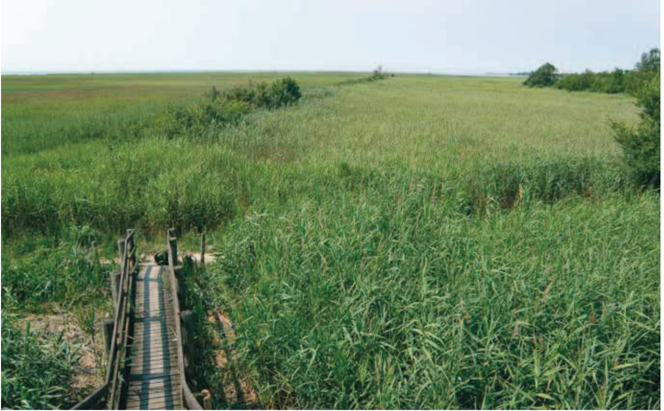
Fig. 4 - Habitat di Zeuneriana marmorata presso la foce del Fiume Isonzo. - Habitat of Zeuneriana marmorata near Isonzo River.