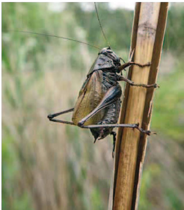
Fig. 2 - Zeuneriana marmorata ♂, Sorgenti del Lisert. - Zeuneriana marmorata ♂, Lisert springs.