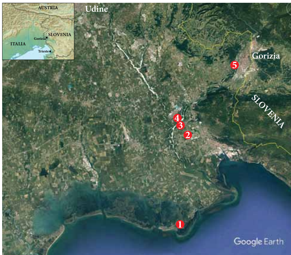
Fig. 2 - Località di rilevamento di A. candefacta descritte nel presente lavoro. 1. Grado; 2. Ronchi dei Legionari; 3. San Pier d'Isonzo; 4. Villesse; 5. Lucinico (Gorizia). - Record sites of A. candefacta described in the present work. 1. Grado; 2. Ronchi dei Legionari; 3. San Pier d'Isonzo; 4. Villesse; 5. Lucinico (Gorizia).

I rinvenimenti qui presentati, relativi ad un territorio posto in prossimità del confine meridionale del Friuli Venezia Giulia con la Slovenia, portano a ipotizzare un ingresso della specie in Italia proprio dai Balcani. In tal senso è noto come il Friuli orientale e la Venezia Giulia rappresentino, fin dagli ultimi eventi glaciali pleistocenici, un vero e proprio corridoio biogeografico tra l'area balcanico-danubiana e quella italiana-centroeuropea, una sorta di "soglia" di passaggio preferenziale per la flora e la fauna (GENTILLI 1988; RUZZIER et al. 2020). Oltre a ciò, si può evidenziare come i siti di San Pier d'Isonzo, Villesse e Lucinico si trovino in prossimità del Fiume Isonzo, corso d'acqua che nasce e scorre per gran parte del suo corso in territorio sloveno ed entra in Italia nel territorio di Gorizia. Vista la diffusione di Ambrosia artemisiifolia lungo i margini del greto fluviale, habitat ideale per la proliferazione di questa pianta, è ipotizzabile che il corridoio fluviale costituito dall'Isonzo abbia rappresentato una via preferenziale di ingresso nel territorio italiano per A. candefacta , che ne ha probabilmente seguito il corso fino alla foce, per poi insediarsi nella vicina area costiera di Grado (il sito di rinvenimento di Grado Pineta dista circa otto chilometri dalla Foce dell'Isonzo). Va tuttavia notato, altresì, come il sito di Ronchi dei Legionari, dove è stato rinvenuto un esemplare adulto, disti meno di un chilometro dall'Aeroporto di Trieste.