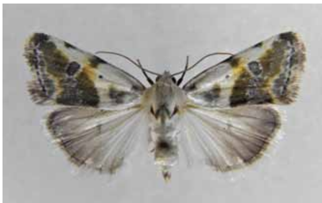
Fig. 3 - Adulto spillato di A. candefacta . Ronchi dei Legionari, 03.VIII.2021, L. Morin legit. - A. candefacta , mounted adult specimen. Ronchi dei Legionari, 03.VIII.2021, L. Morin legit.