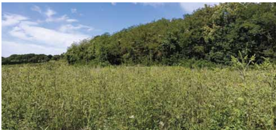
Fig. 5 - Stazione di rinvenimento di A. candefacta presso Lucinico, sul Monte Calvario. In primo piano la prateria colonizzata da Ambrosia artemisiifolia . - Discovery site of A. candefacta at Lucinico, on Monte Calvario. Close-up the meadow colonized by Ambrosia artemisiifolia .

Una situazione per molti aspetti analoga a quella osservata per A. candefacta riguarda il coleottero crisomelide Ophraella communa LE SAGE, specie alloctona anch'essa di origine nordamericana e legata ad Ambrosia artemisiifolia , di cui si nutrono sia le larve sia gli adulti (FUTUYMA & MCCAFFERTY 1990). Le prime segnalazioni in Europa di O. communa risalgono al 2013 e sono relative all'area di Milano e dintorni; al momento non è chiaro come questo coleottero sia arrivato in Europa, ma gli alti livelli di infestazione osservati su piante di A. artemisiifolia dei dintorni dell'Aeroporto Internazionale di Milano Malpensa portano a pensare che sia stato oggetto di introduzione accidentale attraverso il traffico aereo o da scambi commerciali relativi all'aeroporto (MÜLLER-SCHÄRER et al. 2014). Segnalata successivamente (2014) per il Piemonte e l'Emilia Romagna, O. communa viene ritrovata nel 2017 in Veneto e in diverse località del Friuli Venezia Giulia, oltre che in Slovenia e, nel 2018, anche in Croazia (ZANDIGIACOMO et al. 2020): dai dati a disposizione sembra dunque che dal primo rinvenimento a Milano, l'espansione sia avvenuta molto rapidamente verso Est, attraverso l'Italia settentrionale, coprendo oltre 400 km in pochi anni, con una velocità paragonabile a quanto registrato per Acontia